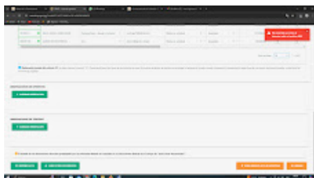
prueba - 01 - 07 - 2024.jpg 231K