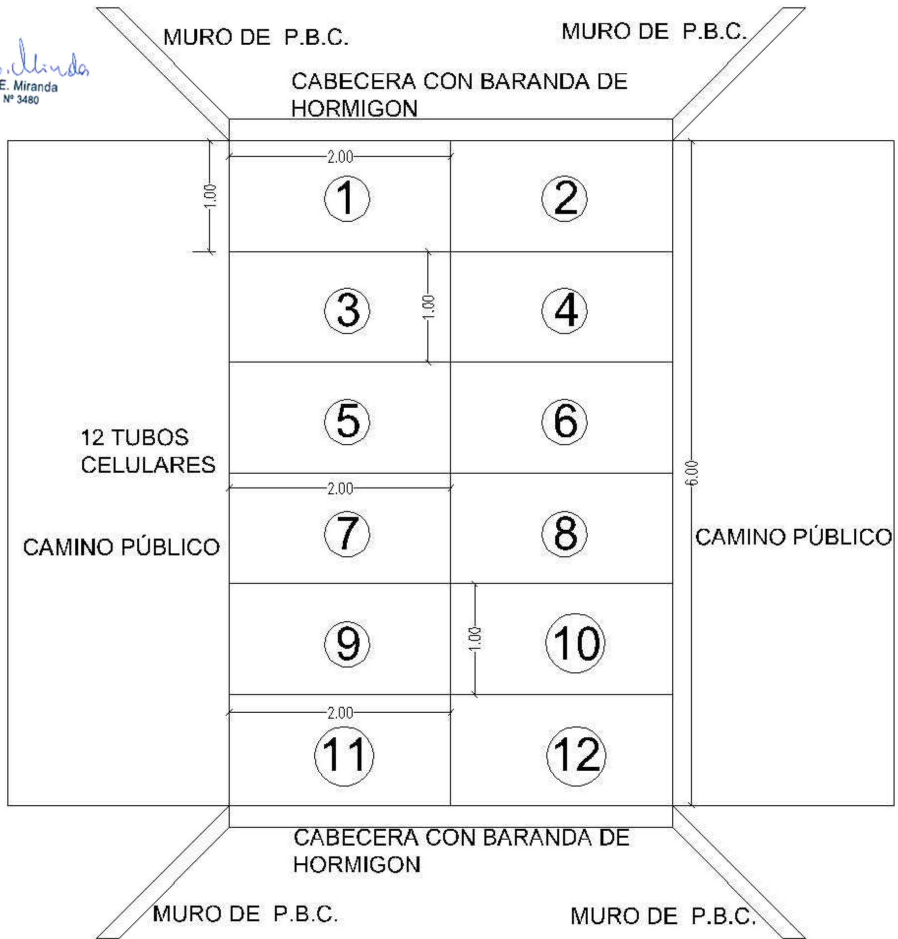
VISTA AREA DE TUBOS CELULARES