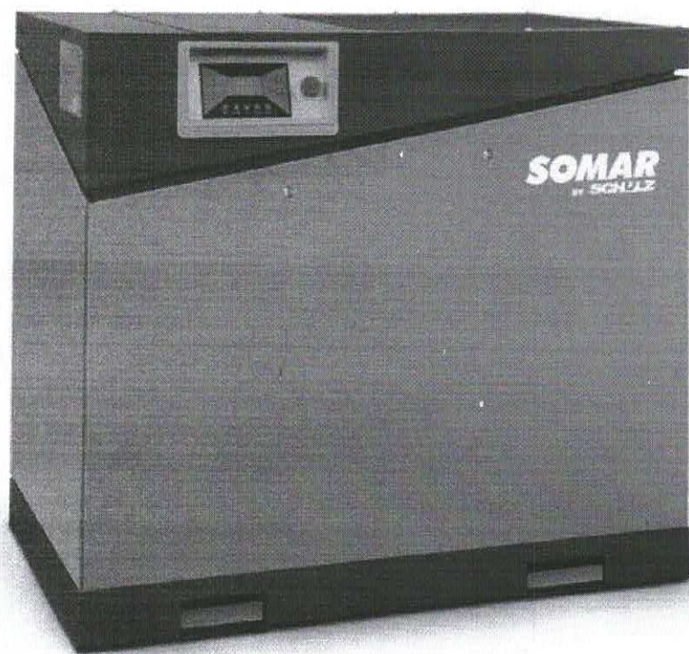
imagen de referencia

/ Compresor Tornillo (/Categoriald-436/AIRE-COMPRIMIDO/Compresores/Compresor-Tornillo.html)